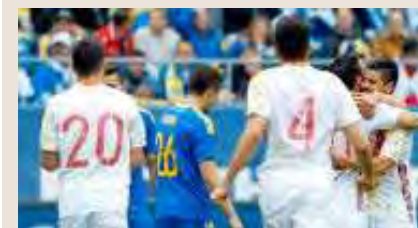
El último España-Bosnia. PABLO GARCÍA

España ya tiene confirmado todo su calendario para 2018. Tras el Mundial se medirá en los partidos de la Liga de Naciones a Inglaterra (Wembley y el Villamarín) y Croacia (Elche y Zagreb). El amistoso de octubre será en Cardiff contra la Gales de Bale y Las Palmas quiere recibir en España-Bosnia del 18 de noviembre. ● M. Á. L.